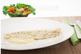
Gest Tilapia kerrie