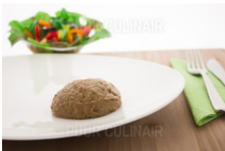
Bourgond. varkensvlees Gm