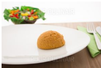
Kippenvlees rode pesto Gm