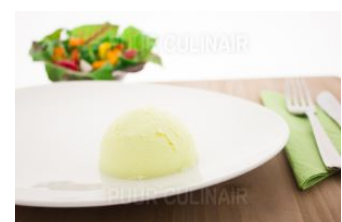
Aardappelpuree iddsi 4