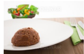
Provençaals rundvlees Gm