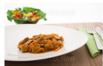
Varkensreepjes zoet zuur