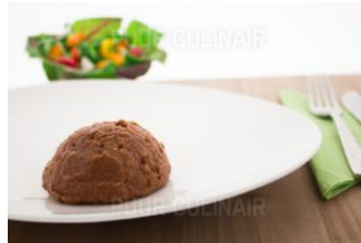
Provencaals rundvlees Gm